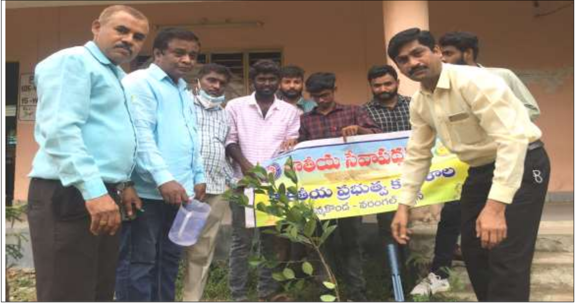
All the faculty members along with NSS units participated in Harithaharam on 31-07-2021