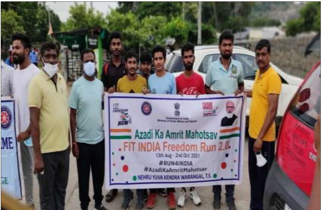
NSS Volunteers participated in 4k Run for Fit India on 13-08-2021